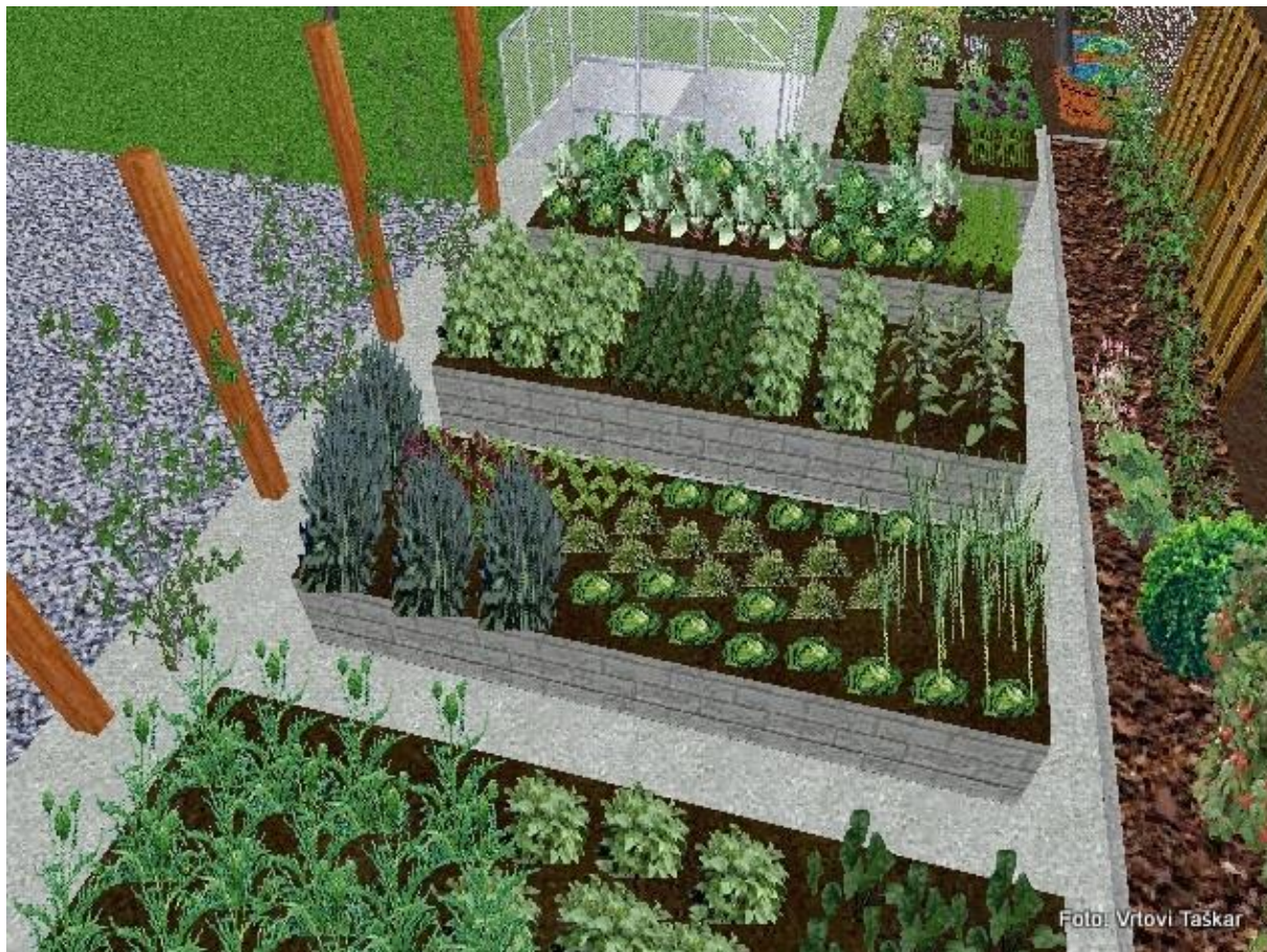
Slika 2: Vrt

Med zelenjavo sadimo čim več zelišč in cvetlic. Varovale jo bodo pred boleznimi in škodljivci, v vrt privabljale čebele in druge opraeševalke ter naravne sovražnike škodljivcev.