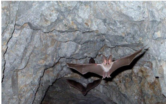
Slika 1: Netopir 3

Netopirji se zatečejo v jame ali hladnejši predele zgradb.