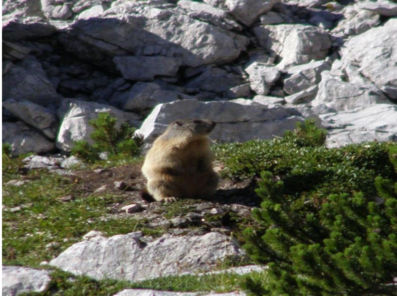
Slika 3: Svizec 5

Svizci zaspijo v svojih domovanjih (rovih).