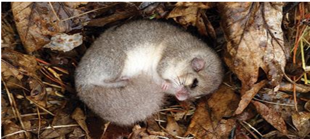
Slika 4: Polh 6

Polha po navadi uvrščamo med živali, ki spijo zimsko spanje. Vendar polh ne prespi cele zime, ampak se na par tednov zbudi, kmalu pa spet nazaj zaspí. 7