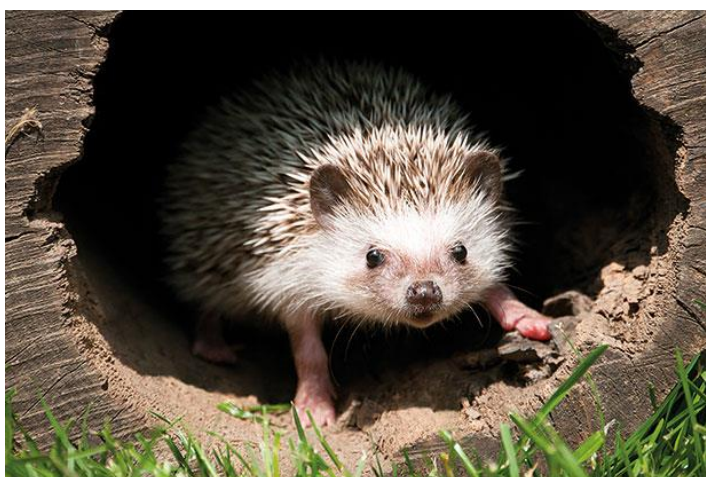
Slika 2: Jež 4

Ježi se zatečejo v svoja gnezda ali kup drv.