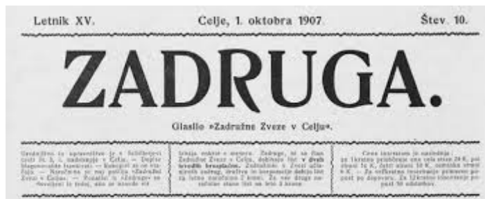
Slika 1: Glasilo Zadruga iz leta 1907 4

Rochdaleski principi (prostovoljnost, nediskriminatornost, motivacija in nagrade, demokratičnost odločanja, samostojnost in neodvisnost, informiranost in izobraževanje, sodelovanje med zadrugami ter odgovornost do družbe), ki jih je ta prva zadruga oblikovala, so še dandanes v srčkanu združništva. 3