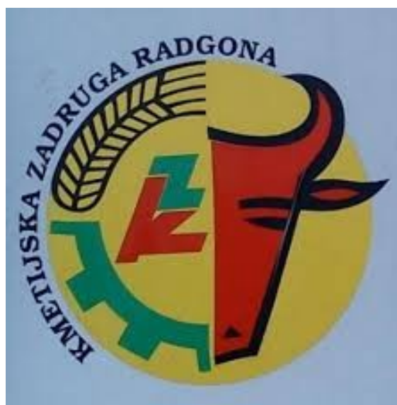
Slika 2: Logotip kmetijske zadruge Radgonez.o.o.

Kmetijska zadruga Radgona je bila ustanovljena leta 1948 na skupščini z omejenim jamstvom v Gornji Radgoni. Zadruga z vmesnimi združenji obstaja še danes in posluje z 14 poslovalnicami v Pomurju (Fokovci, Prosenjakovci, Gederovci, Bogojina, Pertoča, Martjanci), Prlekiji (Apače, Stogovci, Spodnji Ivanjci, Spodnja Ščavnica, Sveti Jurij ob Ščavnici, Gornja Radgona, Radenci in Mura-Vita).